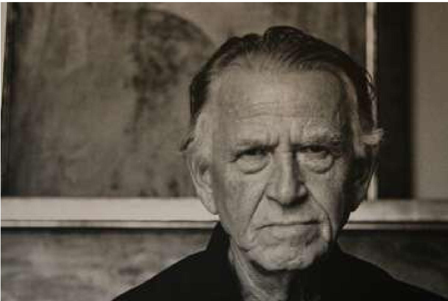
Dix fois Dix